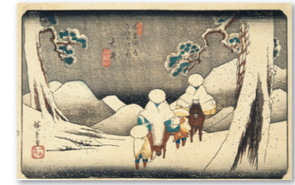
歌川広重「木曾海道六拾九次之内大井」 (中山道広重美術館蔵)

中山道広重美術館は浮世絵版画など約1,400点を収蔵しており、「東海道五拾三次」、「木曾海道六拾九次」など、主に歌川広重の浮世絵などを展示しています。そのうちの400余点に及ぶ浮世絵コレクション、実は株式会社ナカヤマ創業者の故田中春雄が30年にわたって収集した中山道に関する浮世絵と版本なのです。